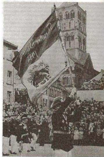
△ Duits vendelen.

Het samenwerkingsverband van de Duitse 'schützenbruderschaften' is na de Tweede Wereldoorlog zeer hoog geweest, waardoor binnen een relatief groot gebied slechts enkele methodes qua vendelen bestaan. De belangrijkste twee manieren worden hieronder uitgelicht: Als eerste is er de Nederrijnse methode, waarbij gebruik wordt gemaakt van een relatief groot vendel van tussen de 1,80 tot 2,60m per vierkant. Er wordt gevendeld op de maat van een wals. Men begint boven, eindigt onderaan en